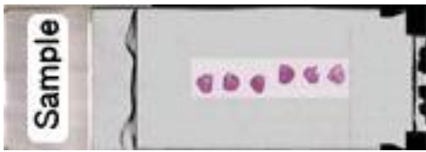
小さな検体の複数切片を1枚のスライドに連続して貼付した例